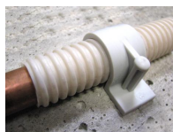
FIX-RING Simple - vue en situation