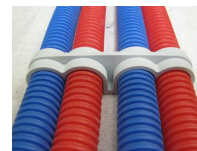
FIX-RING Quadruple - vue en situation