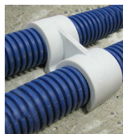
FIX-RING Double - vue en situation