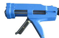
Pistolet super pro 410 ml