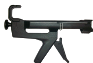
Pistolet robuste 300 ml