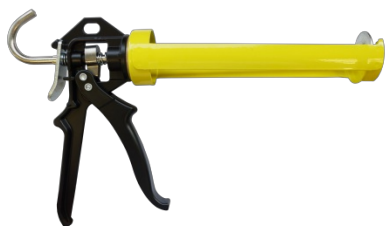
Pistolet pro 300 ml