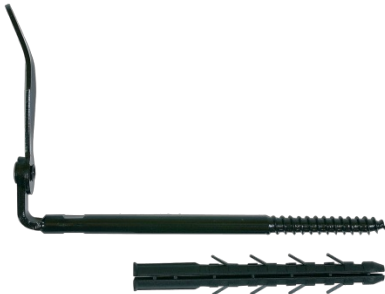
Arrêt de volet parpaing / brique creuse noir