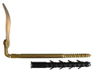
Arrêt de volet parpaing / brique creuse zingué jaune