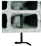
Arrêt de volet parpaing / brique creuse - vue en situation