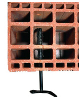
Arrêt de volet parpaing / brique creuse - vue en situation