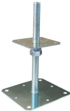
Pied de poteau réglable avec usinage M24