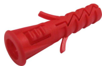
Cheville Secur avec collerette