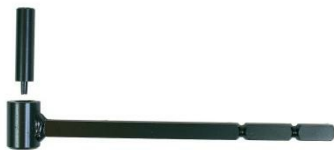
Gond isolation à la résine