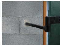
Gond isolation à la résine - vue en situation